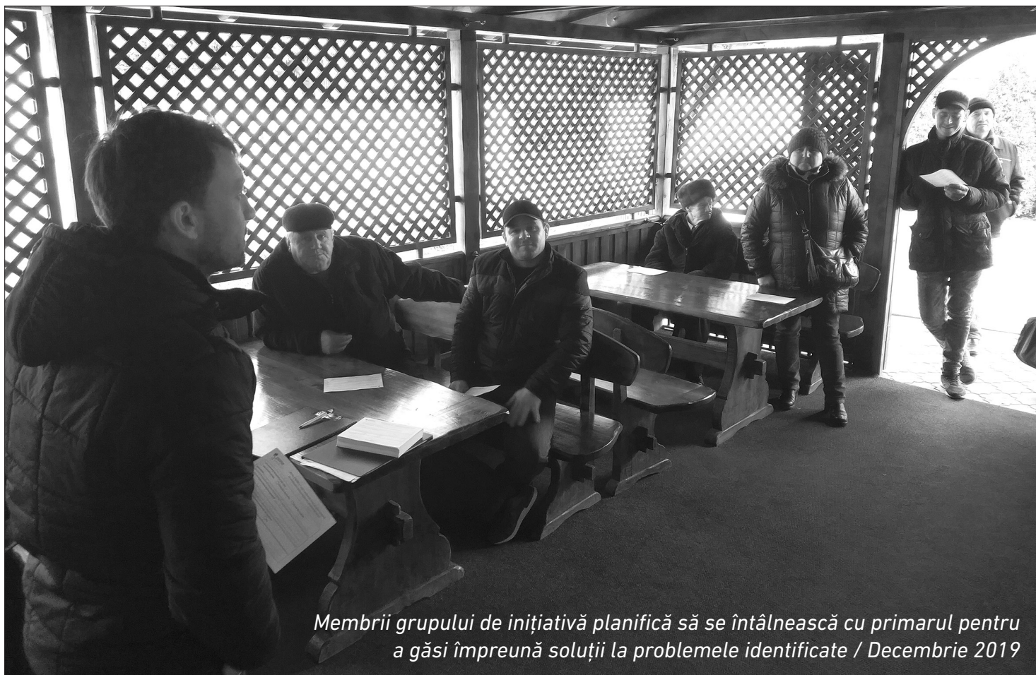
Membrii grupului de inițiativă planifică să se întâlnească cu primarul pentru a găsi împreună soluții la problemele identificate / Decembrie 2019

Dacă doriți să aflați mai multe despre activitatea grupului de inițiativă LĂPUȘNA PUNE UMĂRUL sau vreți să participați la rezolvarea problemelor din Lăpușna, contactați-ne: