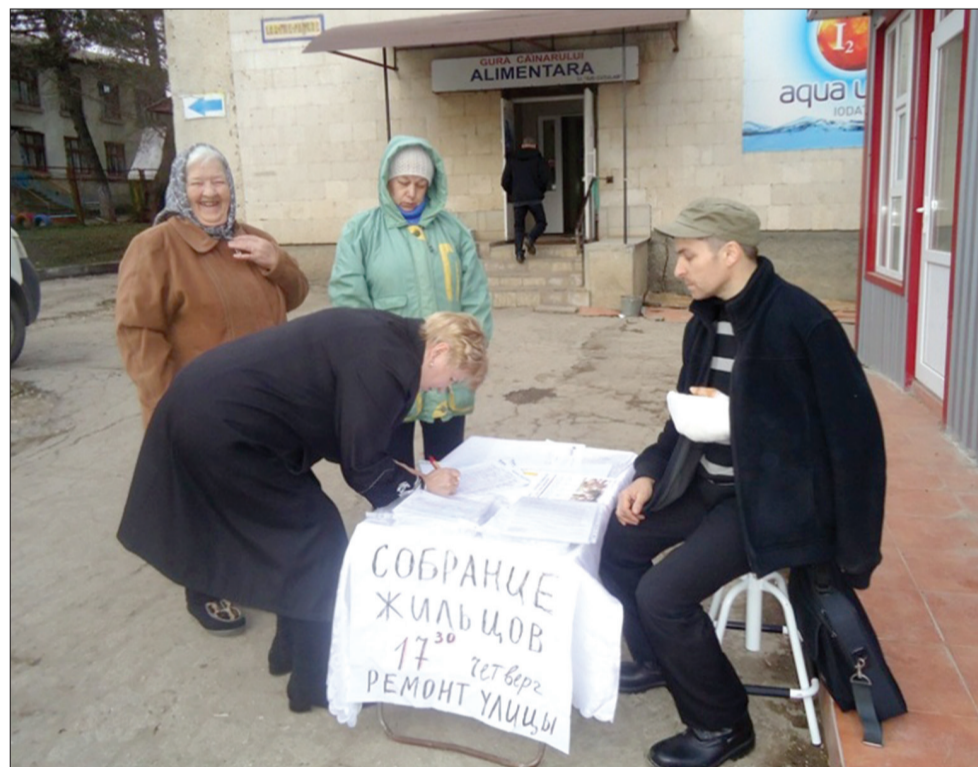
Инициативная группа организовала сбор подписей / март 2016

В дальнейшем члены группы продолжат оказывать давление на власти с целью решения обозначенных гражданами проблем.